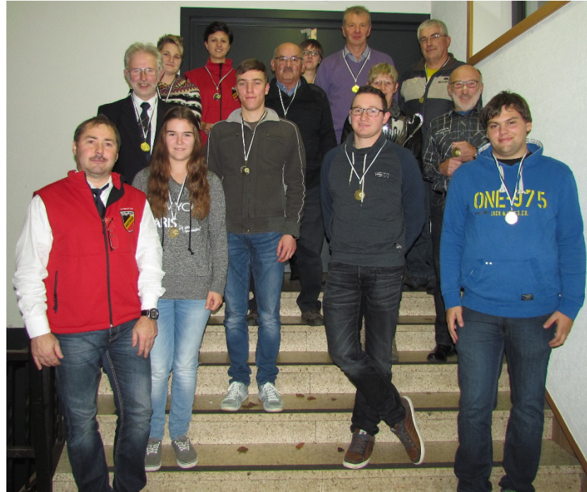
Die noch anwesenden Preisträger mit Wettkampforganisator