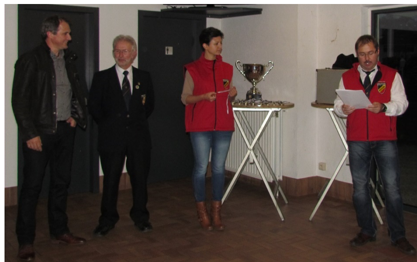
Preisverteilung mit Schöffen der Gemeinde Amel