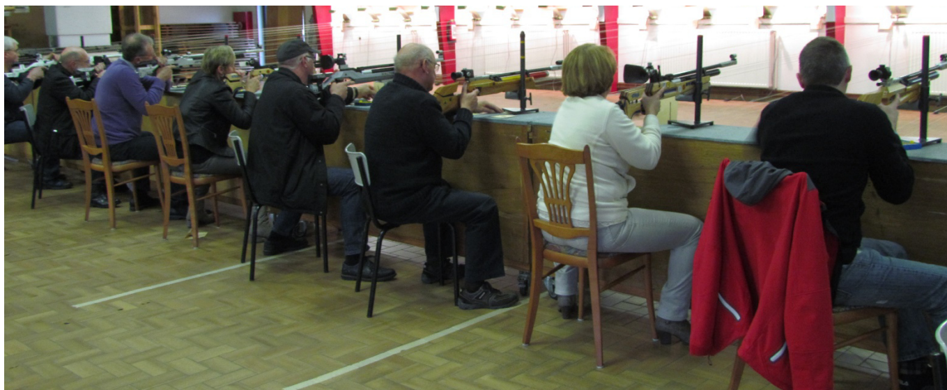
Die Finalisten Aufgelegt