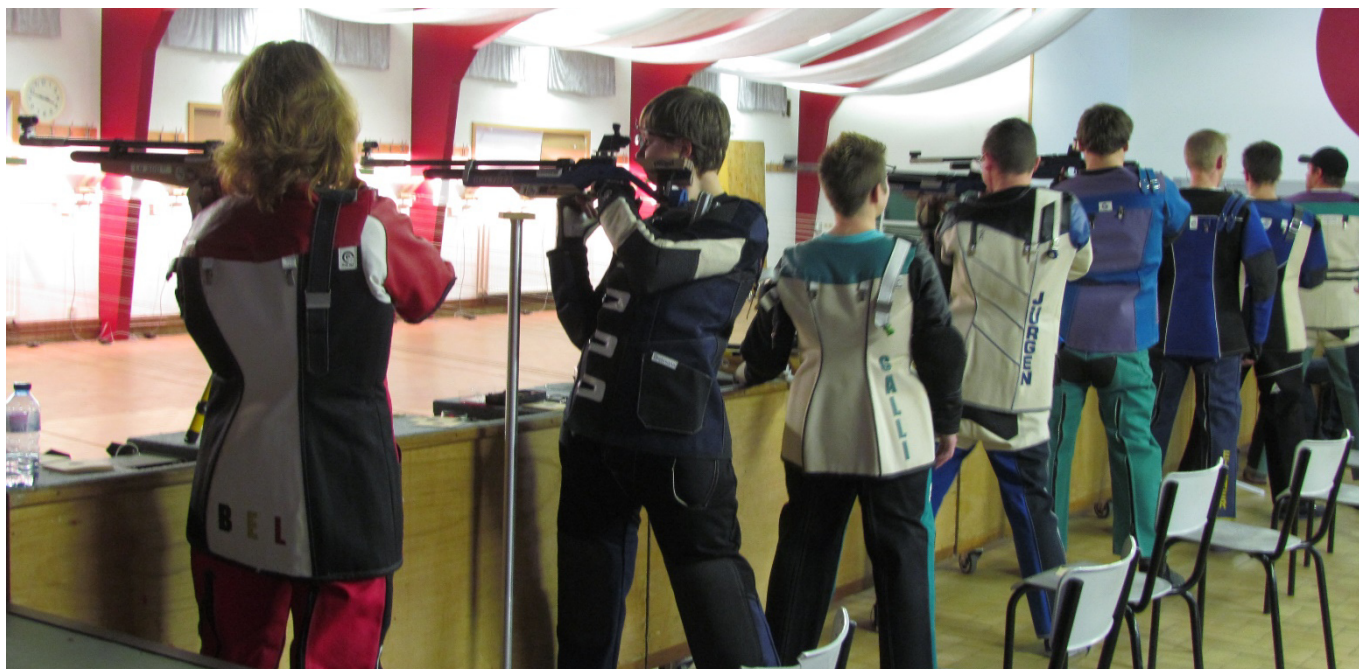
Die Finalisten stehend freihand