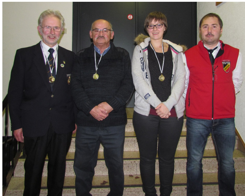
Die Sieger der Finale mit RSFO Präsident und Wettkampforganisator